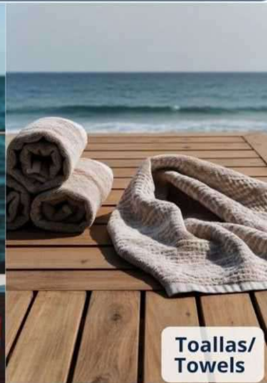
Toallas / Towels