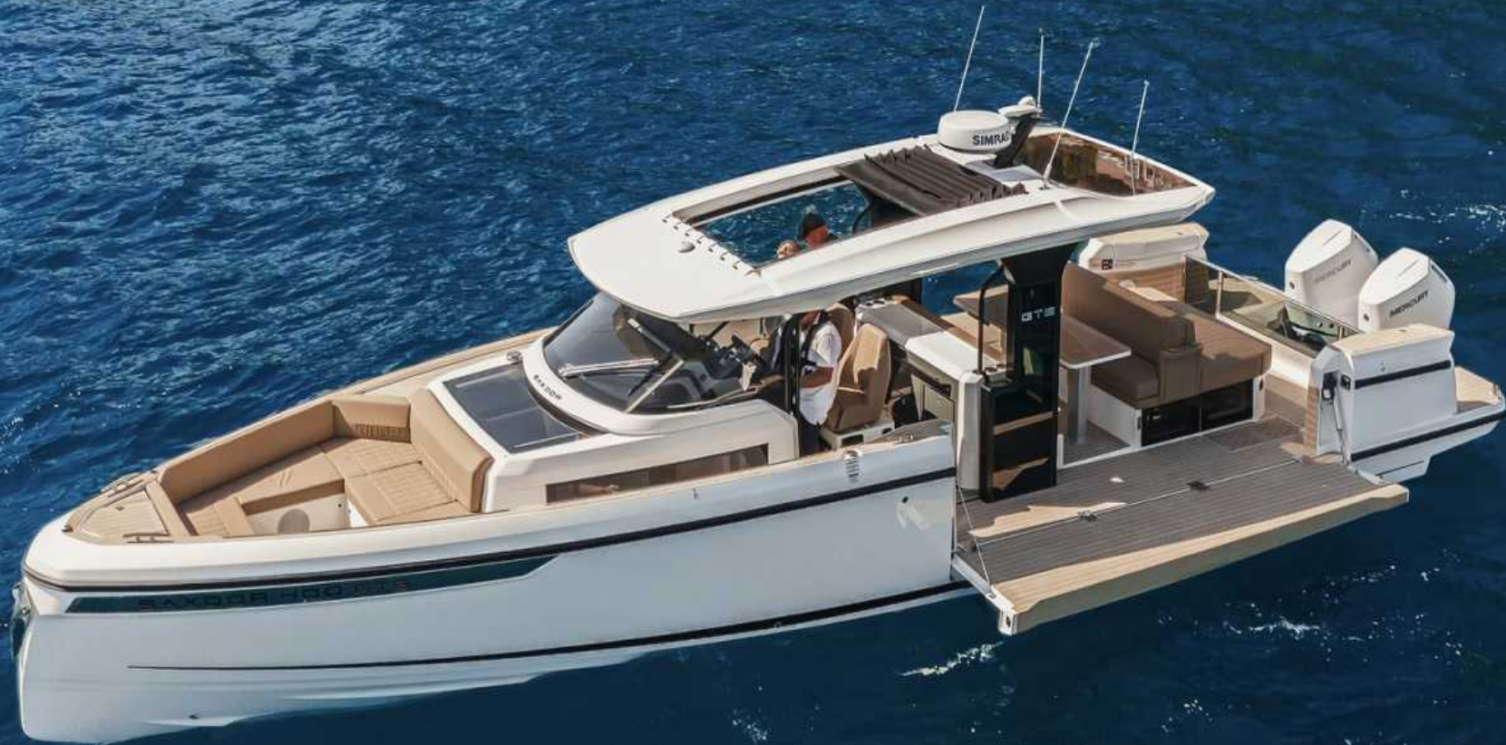
SAXDOR 400 GTS