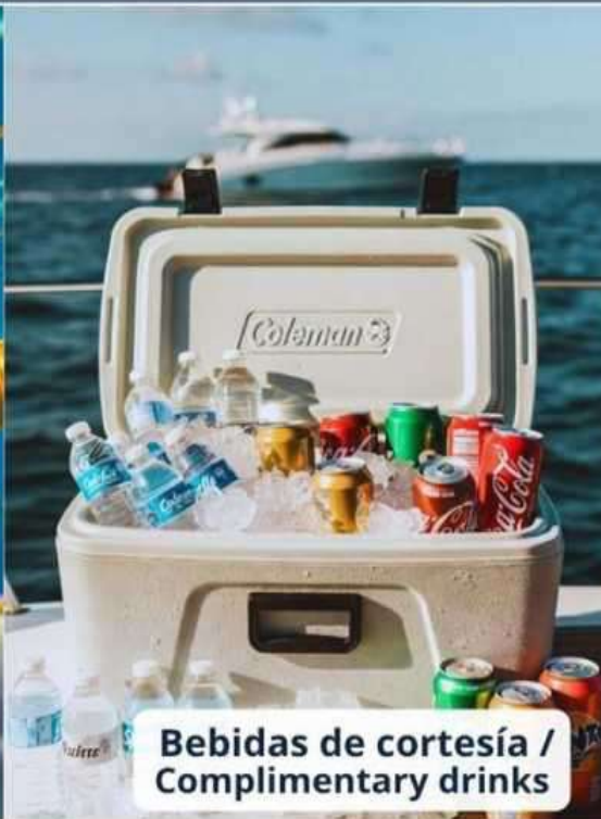
Bebidas de cortesía / Complimentary drinks