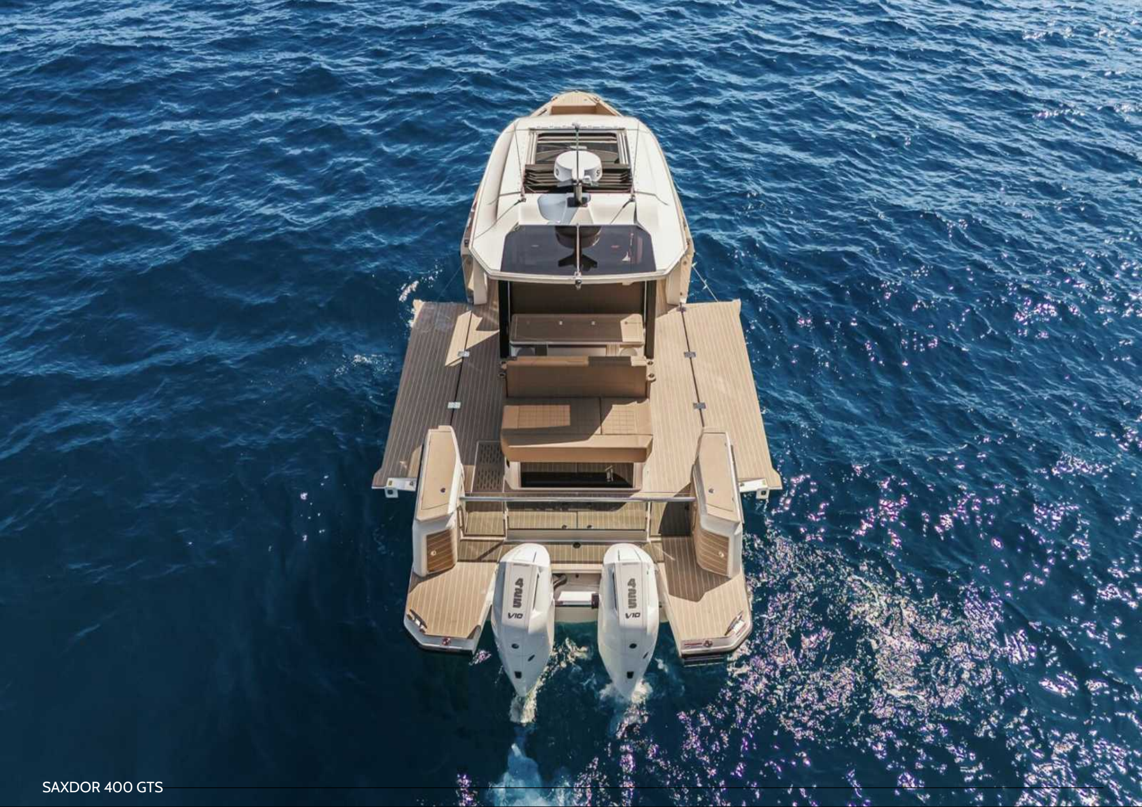
SAXDOR 400 GTS