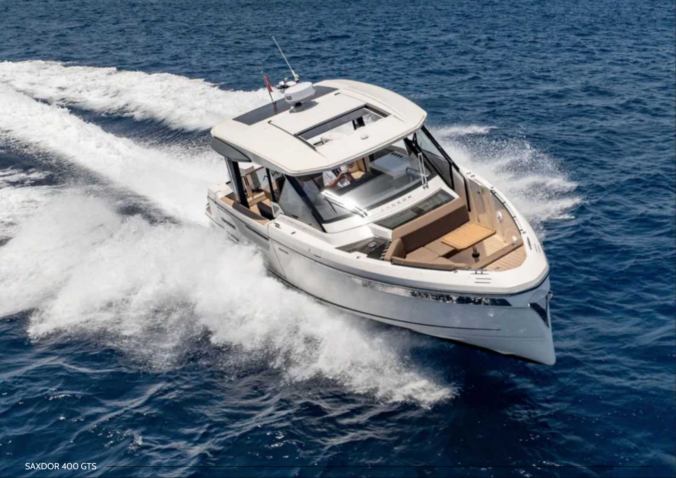
SAXDOR 400 GTS