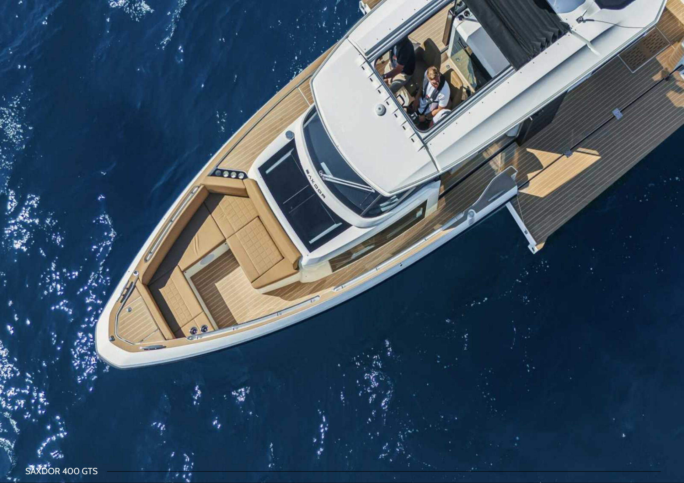
SAXDOR 400 GTS