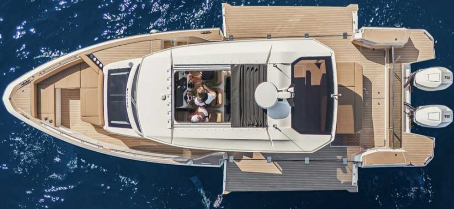
SAXDOR 400 GTS TRUHAN